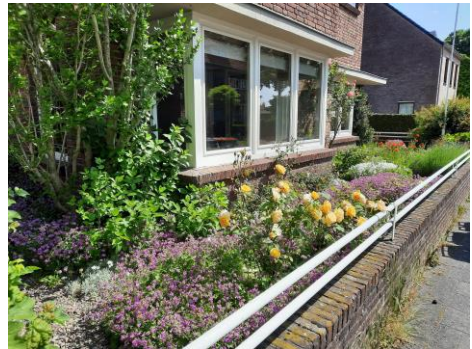
De voortuin (het voortuintje)