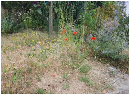
De naar water snakkende achtertuin

Het is warm in Nederland en vooral erg droog. De voortuin trekt zich daar niets van aan, maar de achtertuin is nu tamelijk dor en geel. Ik houd als principe aan om zo min mogelijk te sproeien. Dat het gras geel wordt, is niet meer dan logisch en dat wordt na wat regenval ook vanzelf wel weer groen. Alleen de plantenbakken en de heel jonge plantjes krijgen wat extra water. De andere planten moeten zichzelf maar redden, survival of the fittest , zoiets.