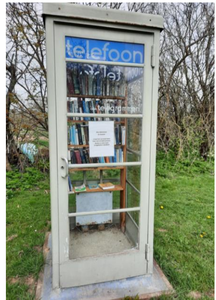
Een ruilbibliotheek ergens in de Betuwe

We lijken van de ene crisis in de andere te rollen. Corona is nog maar net voorbij (en nog niet eens definitief) en dan denkt Poetin zijn miljardenvermogen het beste veilig te stellen door Oekraïne met zijn legers binnen te vallen. Wie weet heeft hij nog gelijk ook: de grootste dieven komen er meestal mee weg. Hopelijk gaat het deze keer anders. Maar voor al dit slechte wereldnieuws heeft u de krant en de tv, dus deze nieuwsbrief gaat over de kleinere zaken, zoals ons afstandsonderwijs en het schoolsucces van uw kinderen. Geen wereldnieuws, maar evengoed wel heel bepalend en in zekere zin de beste garantie voor beter wereldnieuws in de toekomst. Bovendien hebben wij hier wél invloed op.