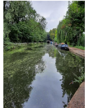
Mooi hè? Toch is ook dit (midden) in Londen!