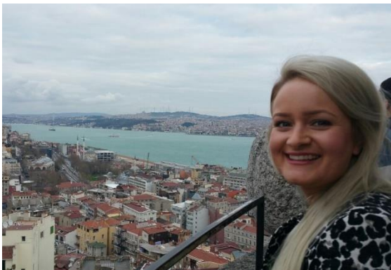
De achtergrond was té mooi om weg te snijden :-)

Ik stel alle leerkrachten hieronder aan u voor. Aan hun eigen leerlingen en hun ouders hebben zij zich natuurlijk wat uitgebreider voorgesteld.